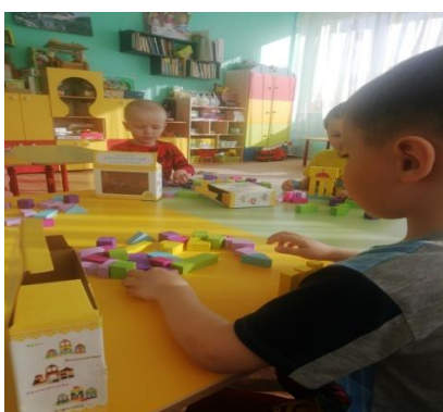
Конструирование : «Дом в котором живет моя семья»