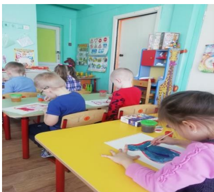
Рисование «Платье для мамы»