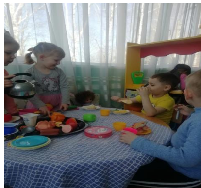
С/р игра «Вечер в семье»