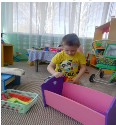
С/р игра «Семья. Папа хороший хозяин»